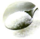
உரிமம் அளிக்கப்பட்ட உப்பு