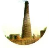
தீ களிமண் அல்லது ஜிப்ஸம்

“நான் ஒரு பருவகால பணியாளர் நான் ஓய்வூதியம் பெற தகுதியானவர்”