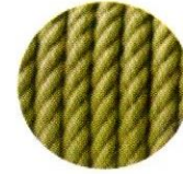
சணல் பேலிங் & பிரஸ்சிங்