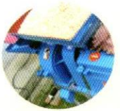
அரிசி அரவை ஆலை