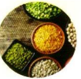
பருப்பு அரவை ஆலை